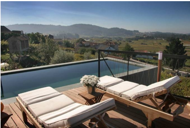
Quinta de San Amaro (Pontevedra)

Toprural, con más de 50.000 alojamientos, dispone de la mayor oferta de alojamientos rurales del sector. Desde alojamientos sencillos y económicos, hasta los más sofisticados que incluyen servicios de spa y wellness , la oferta de Toprural se adapta a todas las necesidades que puedan tener los viajeros rurales.