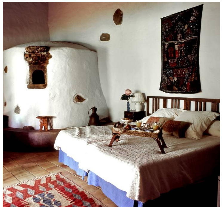
Las Calas (Gran Canaria)