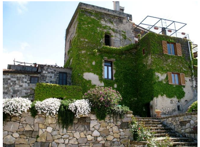
Tore Cangiani (Italia)