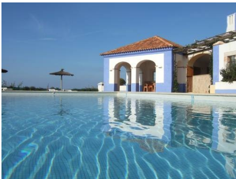
Herade do Touril (Portugal)