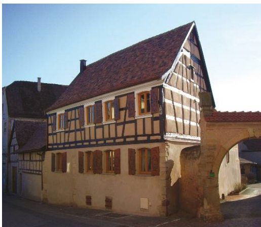
La Rose d'Alsace (France)